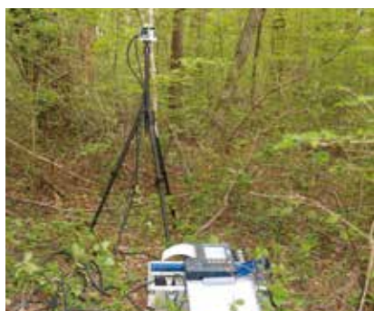
磁界環境測定の様子

※磁束密度と周波数の組み合わせによっては上記の範囲内でも対応できない場合があります。