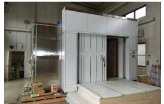
実験研究用磁気シールドルーム