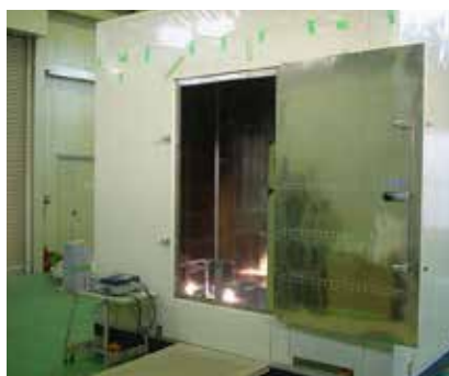
発生磁界測定の様子